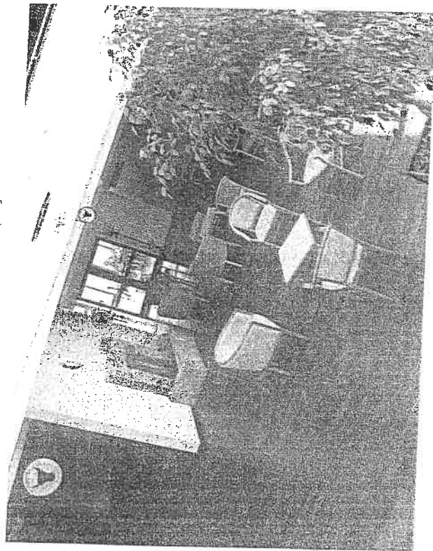
La décoration et le confort relèvent d'un équipement hôtelier de haut niveau.